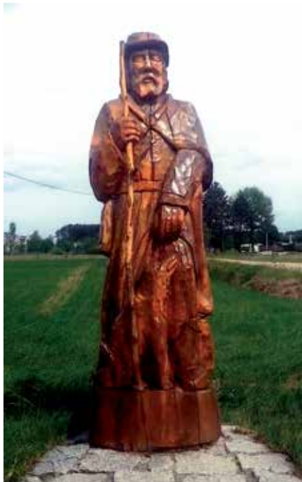
Figura Św. Rocha w Jazgarce z 2013 r., wykonana przez artystę ludowego z Czarni Stanisława Baławskiego.