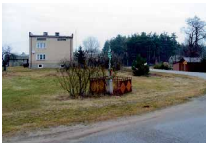
Krzyż powojenny we wsi Grale. Krzyżówka drogi z Kadziłda do Czarni.