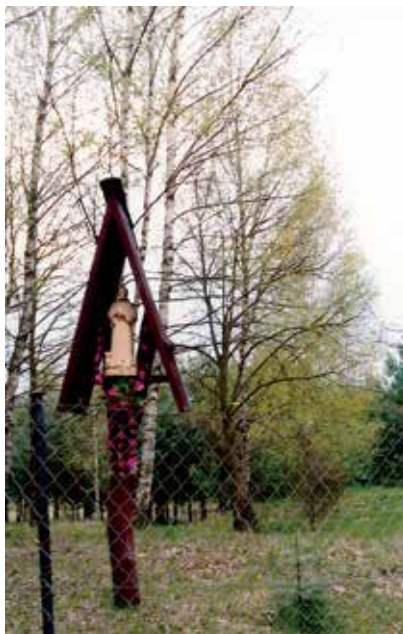
Kapliczka przydrożna w Gąskach, w uroczym zakątku, z figurką św. Franciszka z Asyżu - rzeźba współczesna z roku 2010.