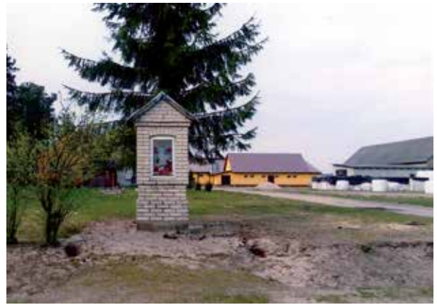
Przydrożna kapliczka z figurą Matki Bożej w Brzozowie.