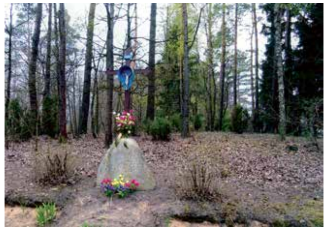
Krzyż z początku XX w. w Gąskach w drodze do Czarni.