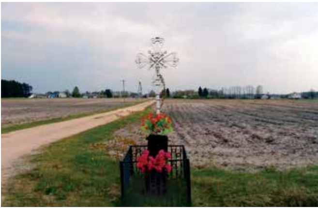
Krzyż przydrożny w kolejnej dzielnicy Brzozowy.