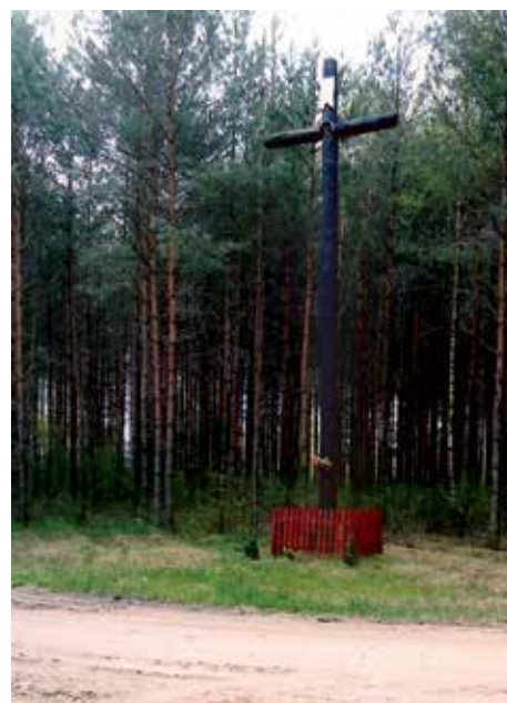
Krzyż na styku wiosek: Gąski, Brzozowa, Czarnia z roku 2010.