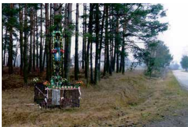
Krzyż powojenny we wsi Baba na skrzyżowaniu dróg Plewki-Czarnia, Kuzie.