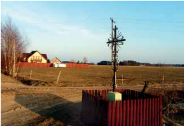
Krzyż w Czarni - dzielnica Podkuzie w kierunku dzielnicy Podwycze, nowy na miejsce bardzo starego krzyża tzw. „Pawłowego”.