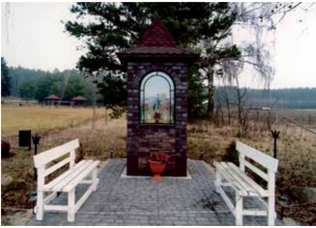
Kapliczka z figurą M. Bożej w Złotej Górze na skrzyżowaniu dróg - Kuzie - Plewki, Dawia wybudowana w 2012r. Miejsce święceń pól, Mszy Św. Polowej i nabożeństw majowych z okolicznych domów i wiosek.