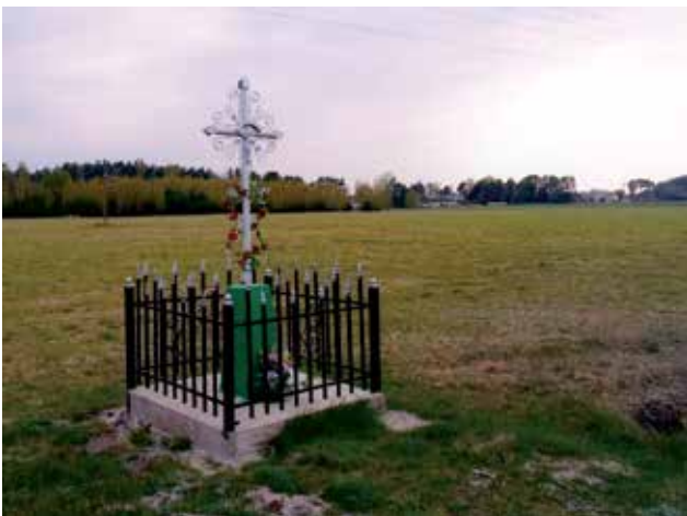
Krzyż przydrożny we wsi Brzozowa - od strony Gąsk.