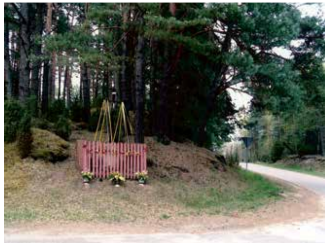
Gąski, skrzyżowanie Stanisłowo - Czarnia.