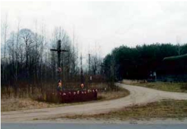
Krzyż stary drewniany, po pierwszej wojnie światowej, nowy metalowy, we wsi Brzozowo - dzielnica Zuzony.