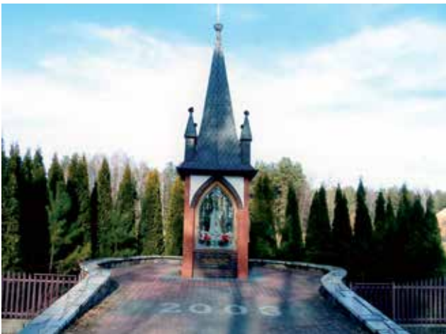
Kapliczka nowa z 2003 r. na drodze z Szafrank do Czarni.