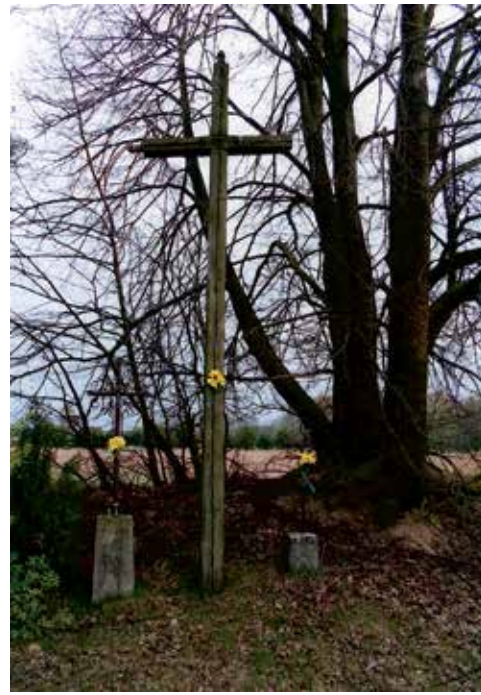
Najstarszy w regionie drewniany krzyż przy- drożny w Brzozowie - w drodze do Grali, z początku XX wieku.