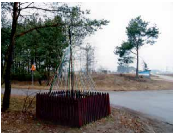
Krzyż powojenny w Czarni - dzielnica Stara Wieś - skrzyżowanie dróg w kierunku dzielnicy Budy i Szafrank.