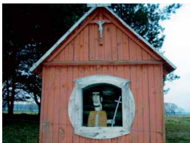
Kapliczka w Gralach z wizerunkiem św. Jana Nepomucena – ludowego artysty, wykonana po wojnie. Stoi przy strumyku z Grali - do Brzozowy i Czarni.