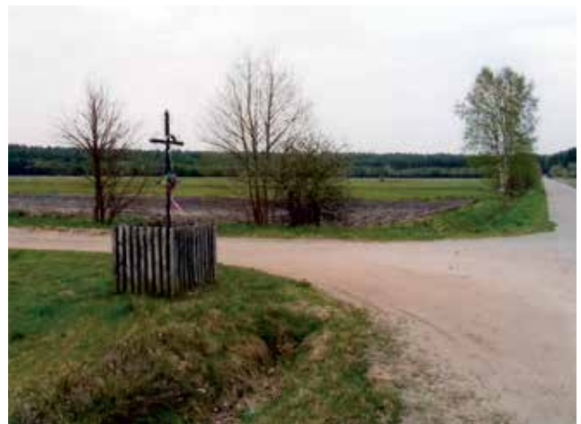
Krzyż na skrzyżowaniu dróg Brzozowa.